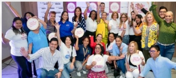
Día de las Buenas Acciones 2025